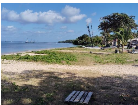
La plage du débarcadère, espace pour le beach-volley, et autres sports sur sable.