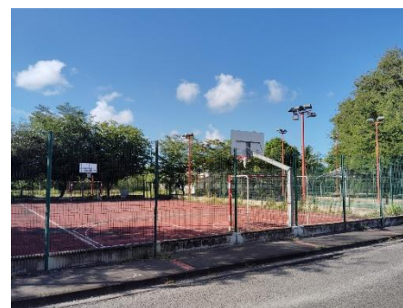
Complexe multisports, Quartier du Bas de la Source. Images : T; Tagliamento