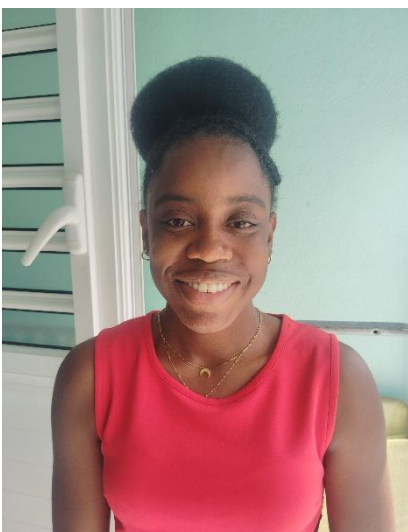
Auraiane, entre Marie-Galante et la Guadeloupe