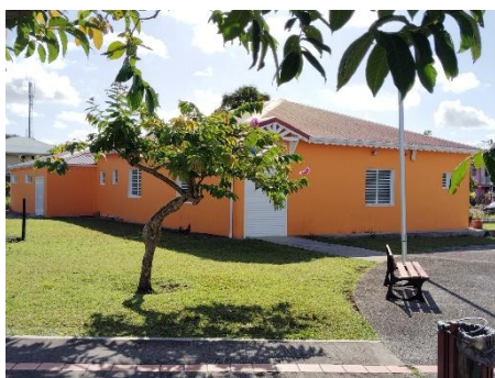
La Maison de la citoyenneté, Place Camille Sopran'n. En attente d'ouverture

On se remémore le passé en regrettant le potentiel gâché.