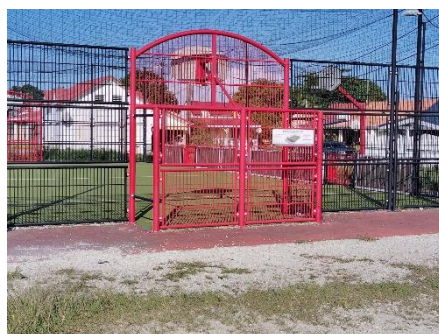
City stade de Desmarais.

Nous n'avons rien à envier aux autres. Il suffit de regarder, de réfléchir et d'agir.