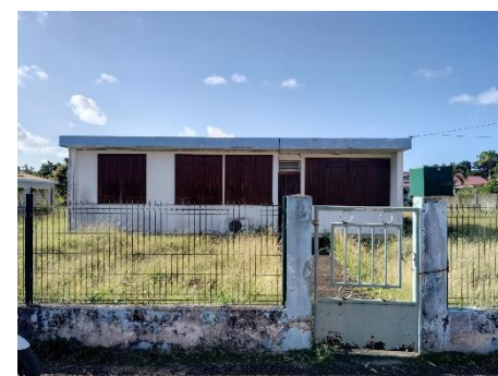
Ancienne bibliothèque municipale, à côté de la salle polyvalente. Un local que des jeunes souhaitent acquérir.