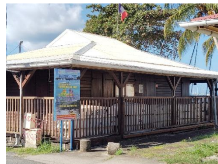
La base nautique du CISMAG, Av. Légitimus. Pour créer des champions en sport nautique.