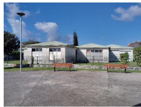
Ancienne école maternelle, lieu culturel encore actif - Av. Nelson Mandela.