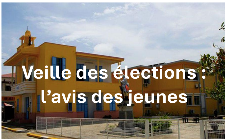
Mairie de Saint-Louis.

« J'ai beaucoup de choses à dire sur notre situation à Saint-Louis. Nous, les jeunes, on pourrait plus avancer en faisant bon usage des structures déjà présentes sur la commune. Il faudrait que les élus ne laissent pas les jeunes à l'écart, et c'est ça le problème :